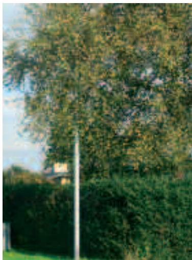
Dette billede behøver vist ingen forklaring!