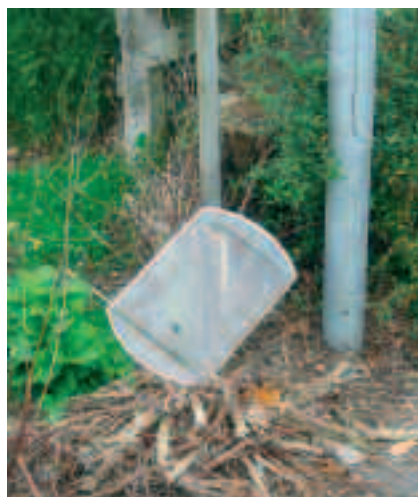
Nedblæst lampeglas Brydeholm oktober 2008