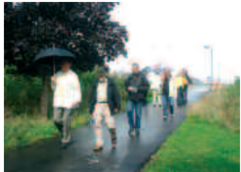
Besigtigelse af støjsluse

eningens bestyrelse havde gjort indsigelse mod disse ikke-godkendte projekttændringer. Disse ændringer ville efter vor mening forringe beskyttelsen mod vindbåret støj fra motorvejen i vort område (støjsluser). Oprindeligt var der her projekteret og godkendt en tunnel gennem støjvolden.