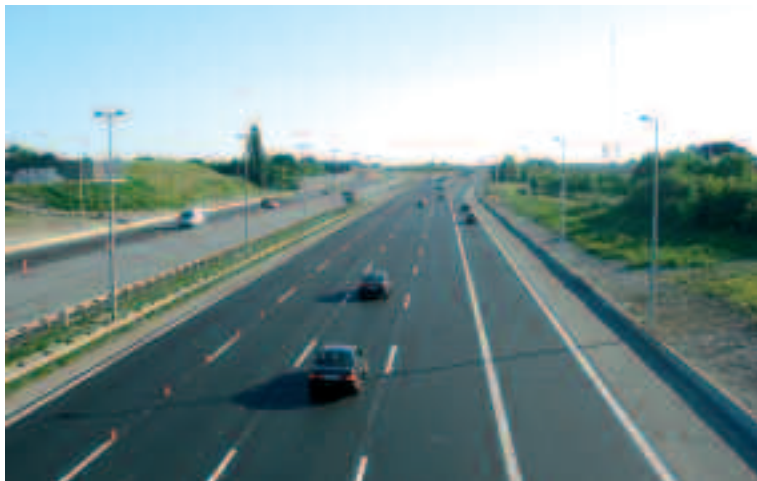
Greve Nord - sydgående. Snart færdig.