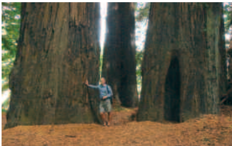
Træer, der vil noget!

H elt så store som vist på billedet er vore rabattræer ikke blevet endnu. Men flere steder er de nu i årenes løb alligevel blevet ganske voldsomme og trækroneerne fylder godt op i landskabet. Det betyder sandsynligvis også, at bestyrelsen i en ikke altfor fjern fremtid bliver nødt til nogle steder at se nærmere på, om ikke nogle af de meget voldsomme og grimme rabattræer samt også rabattræer, som står uhensigtsmæssigt i forhold til en ellers belydningsmæssigt fornuftigt anbragt lysmast må ‘lade livet’ af hensyn til en optimering af vejbelysningen.