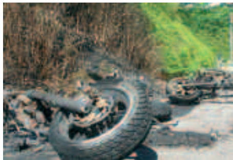
Afsvedet buskads og afbrændte knallerter ved Sløjen