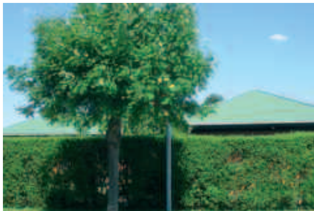
'Genial' masteplacering på Storebjerg

holm, hvor der dannes kæmpestore og dybe vandpytter efter regnvejr.