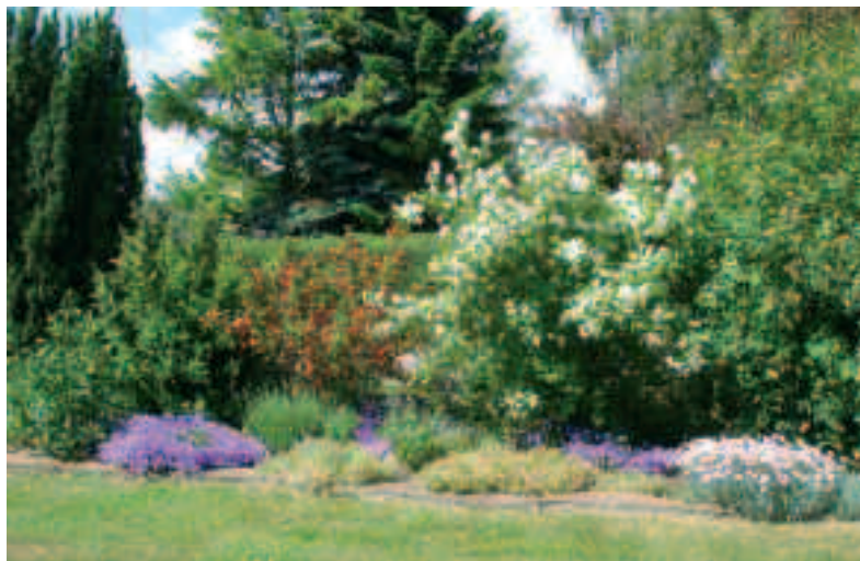
Blomstrende buske og klokkeblomstpuder