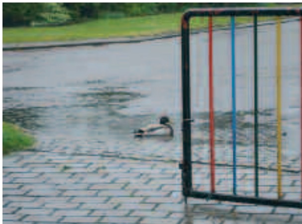
‘Andedam’ på Knøsen

Det må vel egentlig være en garanti-sag mellem kommunen og entreprenøren - eller hvad??