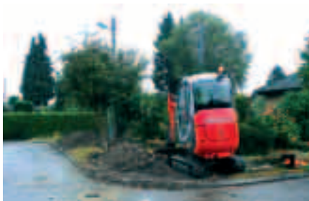
Åben kabelrende på 3. måned