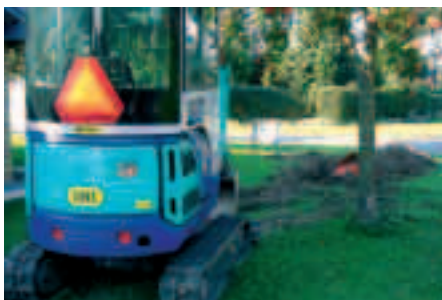
Om igen - glemt kabelnedlægning