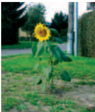
Retableret rabat på Brydeholm!