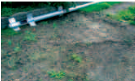
Tilsået rabat på Rugbjerg