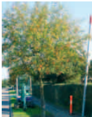
Fejlplaceret lysmast på Røjlerne